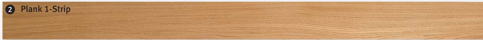
2 Plank 1-Strip