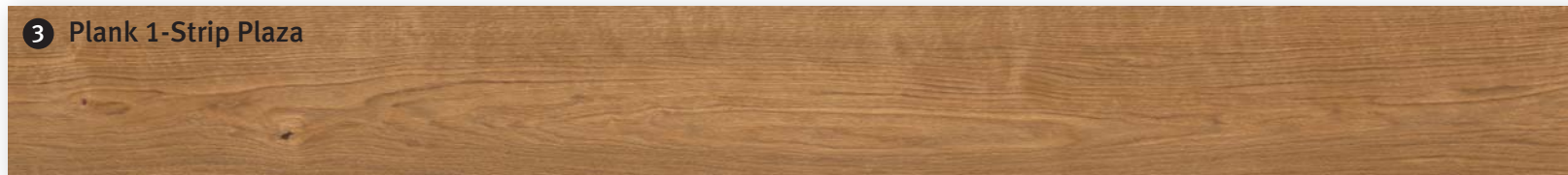
3 Plank 1-Strip Plaza